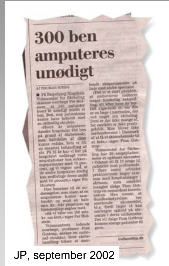
JP, september 2002