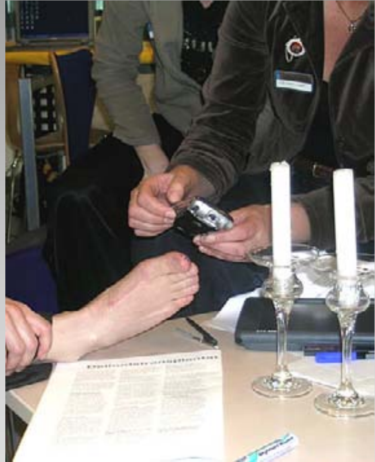
Workshop, telemedicin, den 20. januar 2005